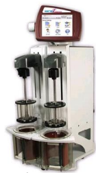
Disintegration-Tester „DISTEK 3200“ mit Infrarot-Endzeitbestimmung