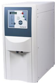
Mediumtankstelle „DissoPrep“ für schnelle und hochpräzise Mediumherstellung und Dosierung