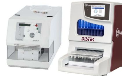
Autosampler für individuelle Ansprüche beim automatisierten Probenzug – z.B. der „DISTEK 5300“ mit optionalem Filterwechsler*