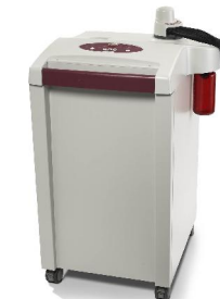
Vessel-Washer „DISTEK VIP 4400“ für die schnelle Reinigung der Vessels im Dissolution-Tester