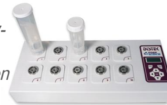
Content-Uniformity- Tester „DISTEK PrepEngine“ für einen schnellen Gleichförmigkeitstest