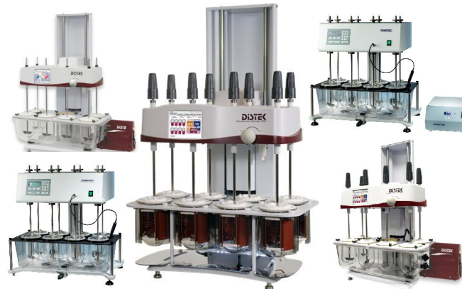
Dissolution-Tester z.B. ohne Wasserbad der „DISTEK 2500 Select“