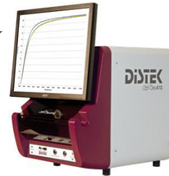
Fiber-Optic-UV „DISTEK Opt-Diss“ für Echtzeit- Messung und Alternative für teure HPLC- Analysen