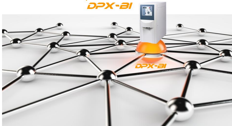
DissoPrep – Browser-Interface DPX-BI