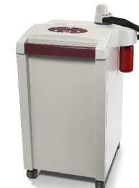
Vessel-Washer „DISTEK VIP 4400“ für die schnelle Reinigung der Vessels im Dissolution-Tester