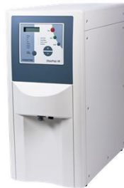
Mediumtankstelle „DissoPrep“ für schnelle und hochpräzise Mediumherstellung und Dosierung