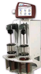
Disintegration-Tester „DISTEK 3200“ mit Infrarot-Endzeitbestimmung