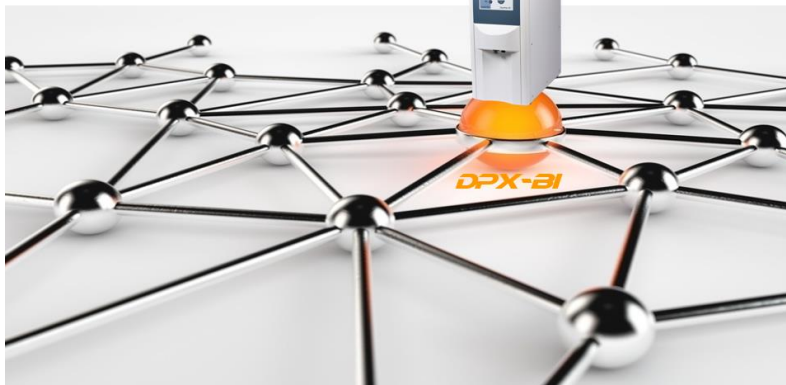
DissoPrep – Browser-Interface DPX-BI